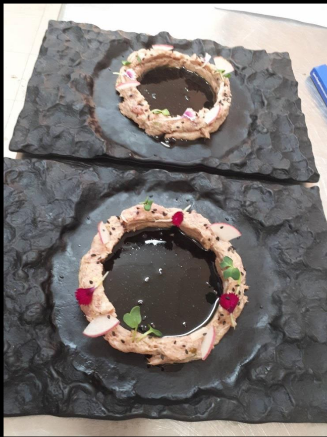
Pasta z tuńczyka