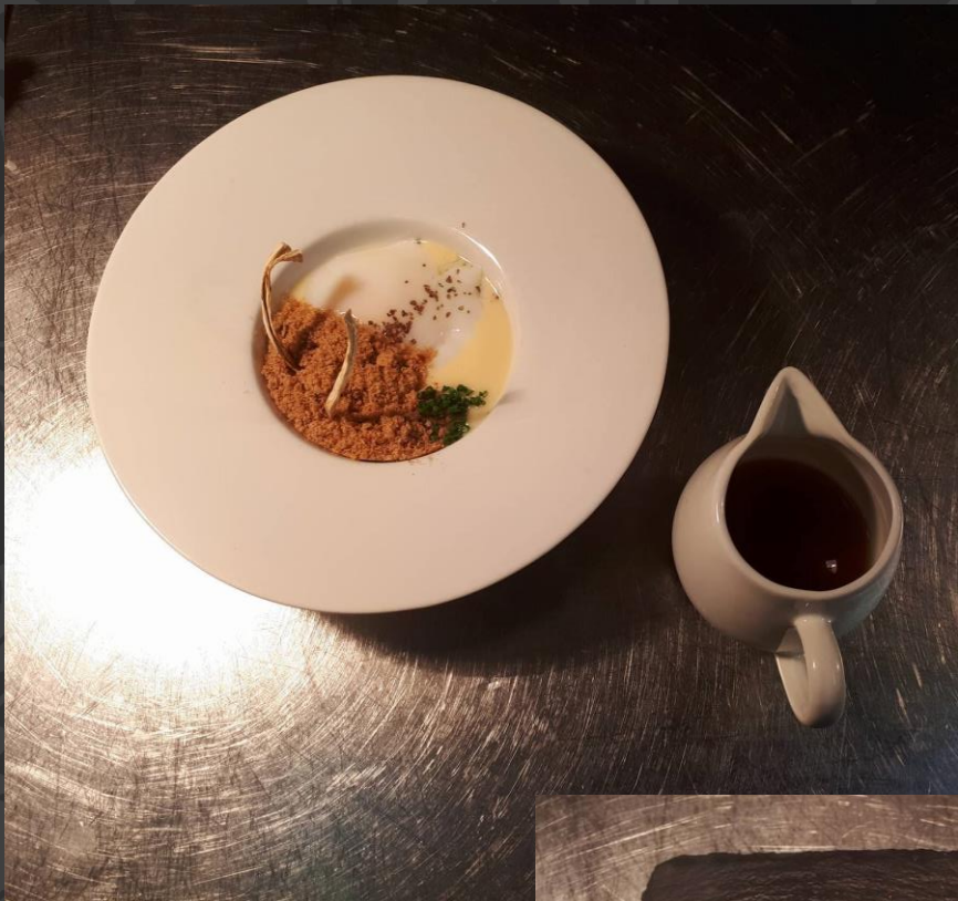
Jajko z puree