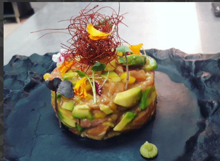
Tatar z łososia