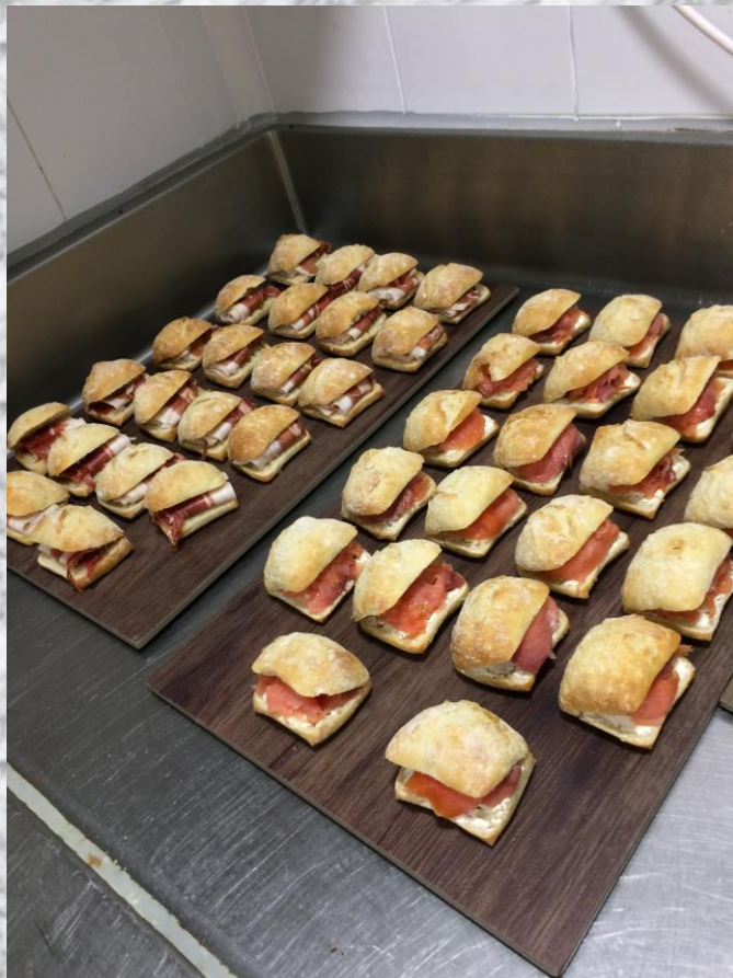
Sandwich con jamon y salmon