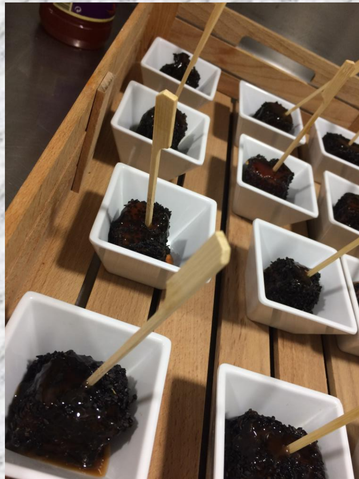
Atun con negro sesamo