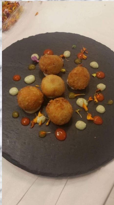
Croquetas con jamon