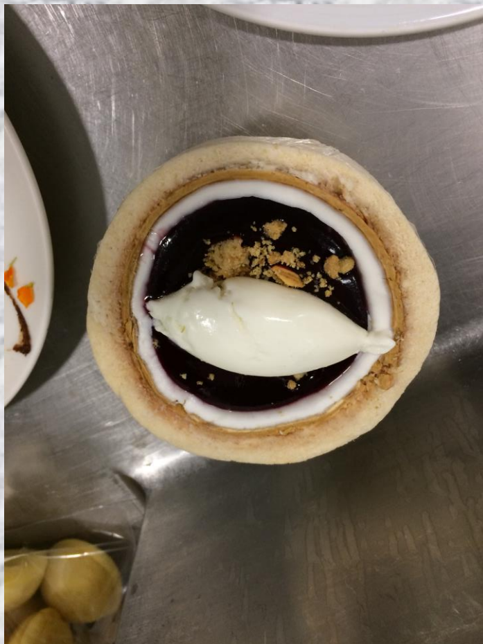
Sopa de hibiscus