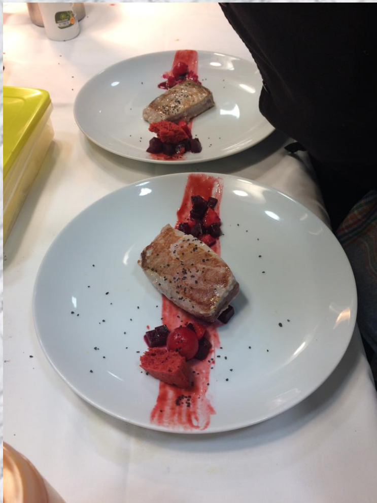
Atun con salsa fresas