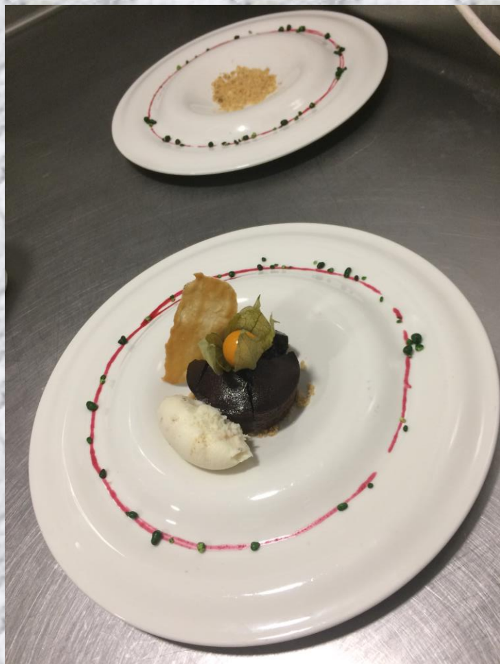
Coulant de chocolate