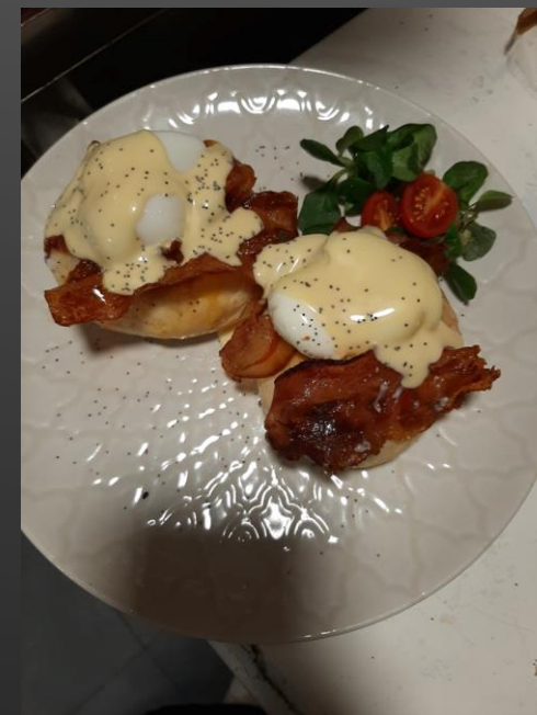
Kanapki z bekonem