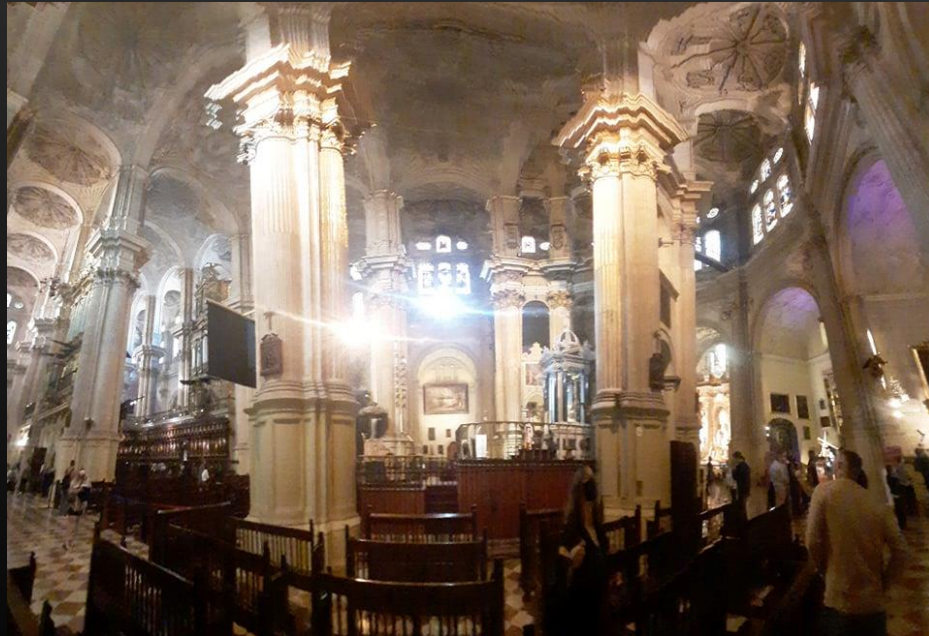
Katedra w Maladze