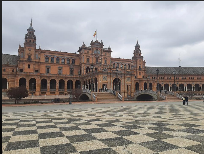
Plaza de España