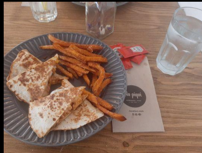
Quesadilla z frytkami z batatów