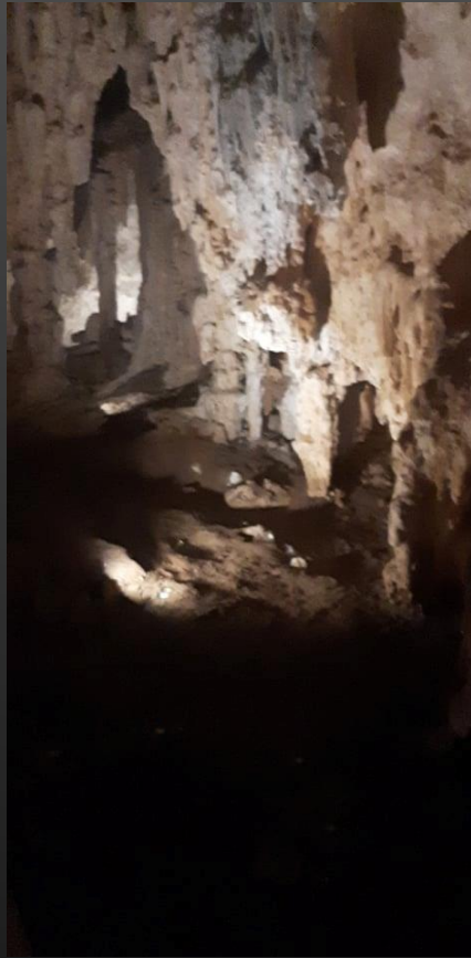
Jaskinia z największym Stalagnatem