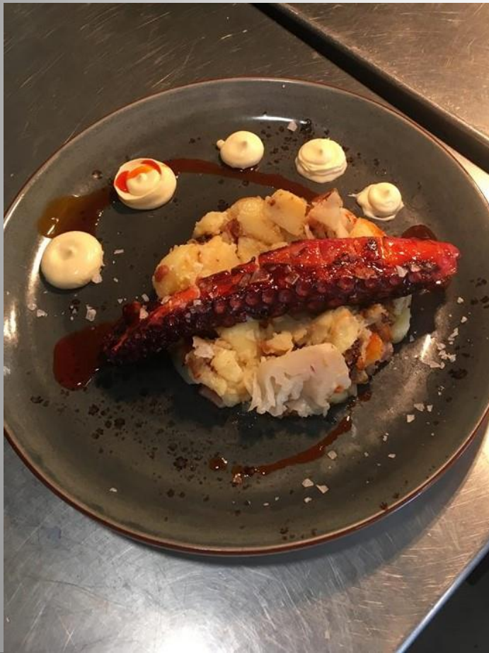
Pulpo ahumado sobre trinchat de patata y panceta