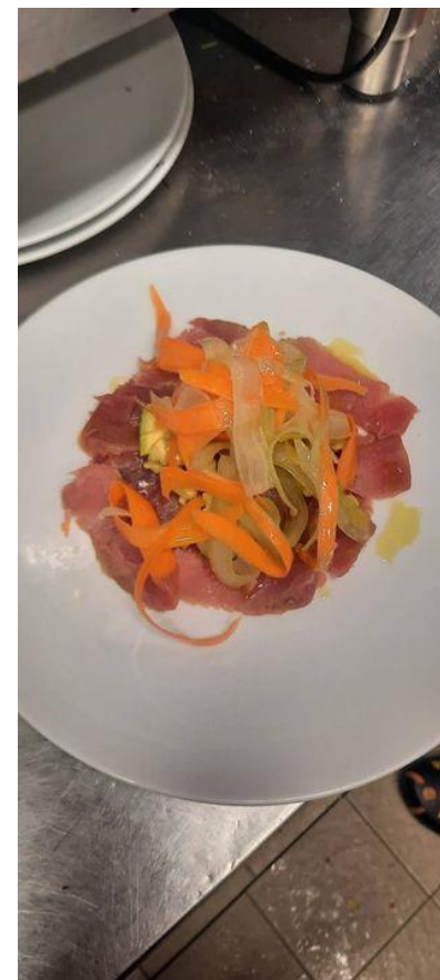
Carpaccio di tonno