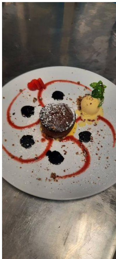
Tortino di Cioccolato