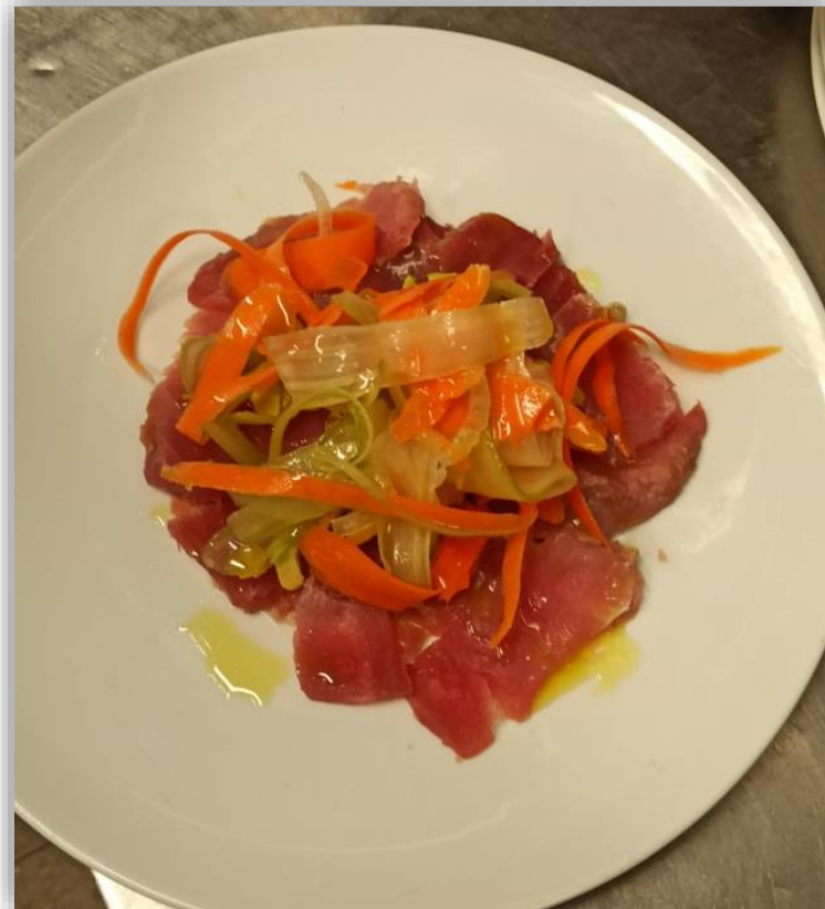
Corpaccio di tonno con julienne di verdure croccanti con avocado