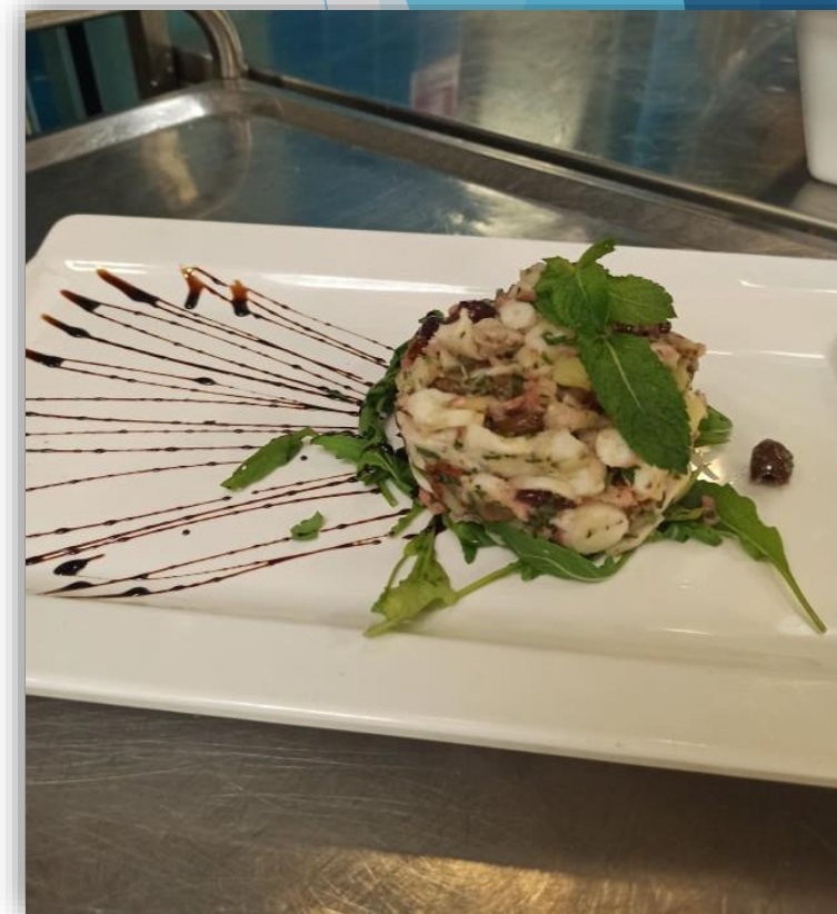
Insalata di gamberi, sedano, pomodorini, rucola e parmigiano e salsa al balsamico