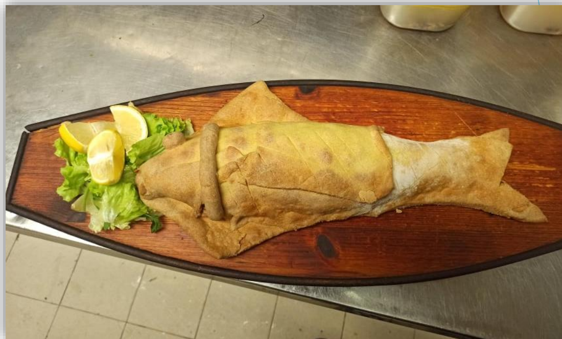
Branzino in pasta di pane e sale