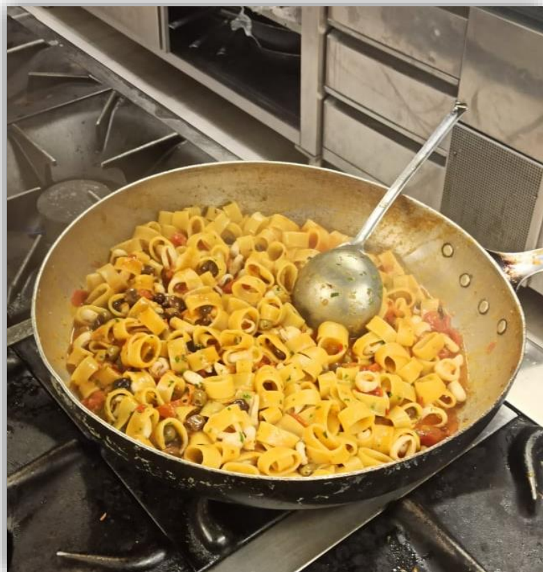
Calamarata alla siciliana con pasta calamarata, calamari, acciughe, olive taggiasche, pomodorini e basilico

ZESPÓŁ SZKÓŁ GASTRONOMICZNO-HOTELARSKICH W GDAŃSKU