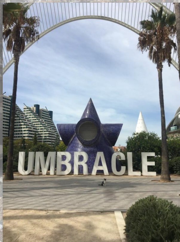
Rzeźba w ogrodzie palmowym