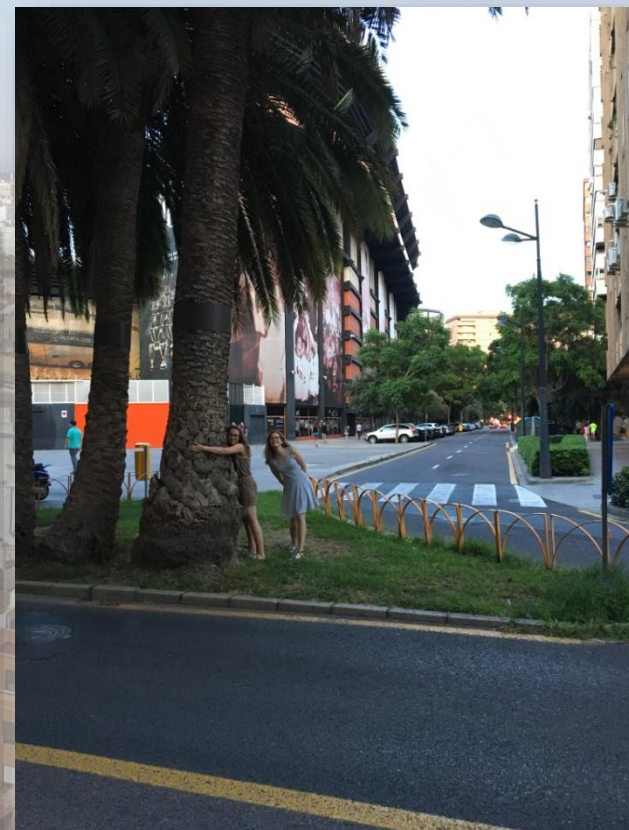
Palma obok naszego miejsca zamieszkania