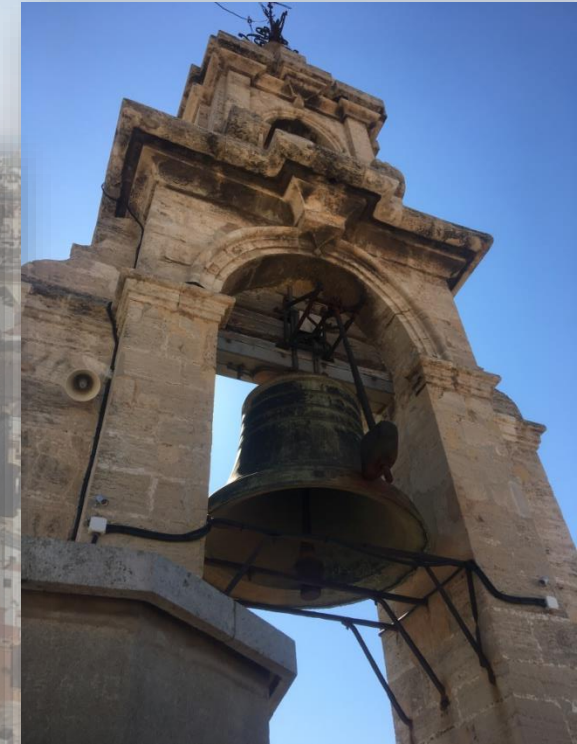
Dzwon na wieży katedralnej