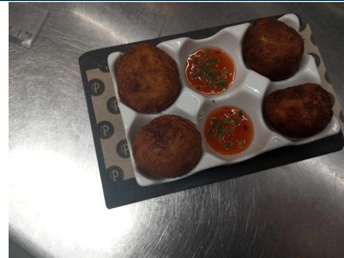
Croquetas de Pollo