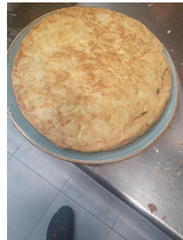
Tortilla de patatas