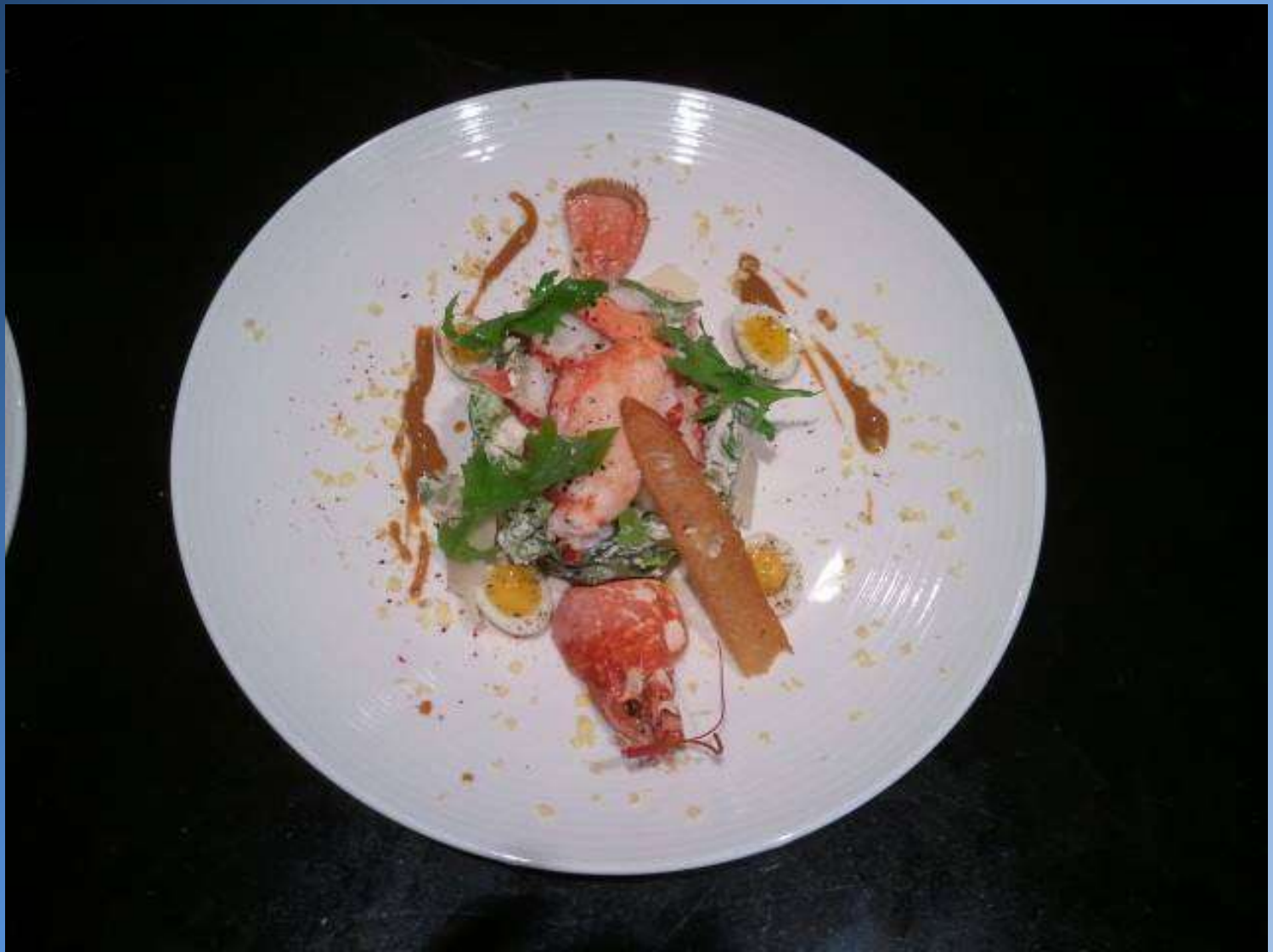
Salade de Homar