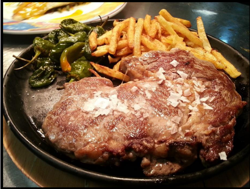
cuello de cerdo con patatas y pimientos