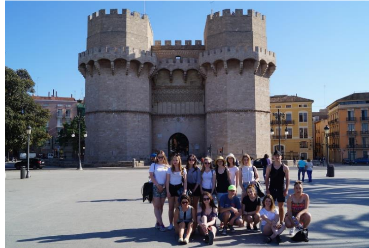
Torres de Serrano