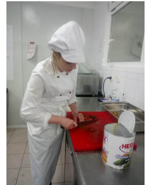
Pomaganie podczas śniadań (krojenie szynek, serów itp.)