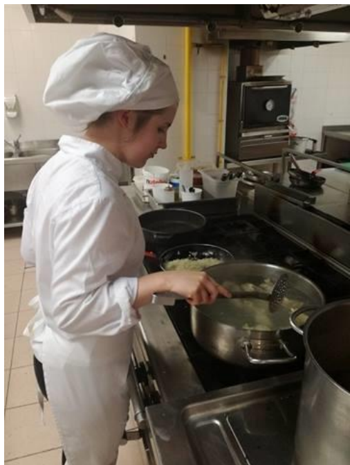
Gotowanie polskich pierogów dla kucharzy