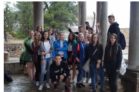
Ruiny zamku w Sagunto