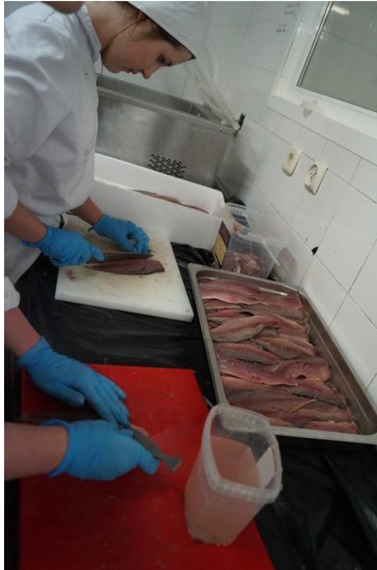
Filetowanie ryb na kolację dla 100 osób