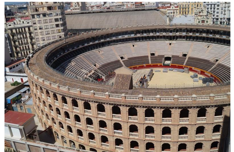
Plaza de Toros