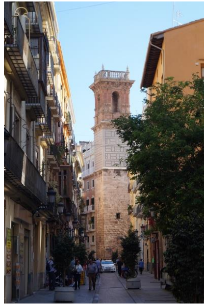
Jedna z uliczek Walencji