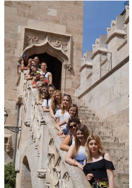
Lonja de la Seda