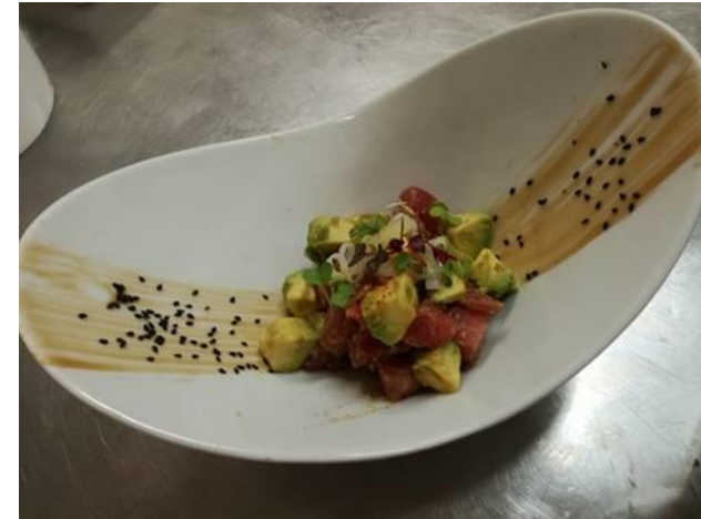
Tatar de atun