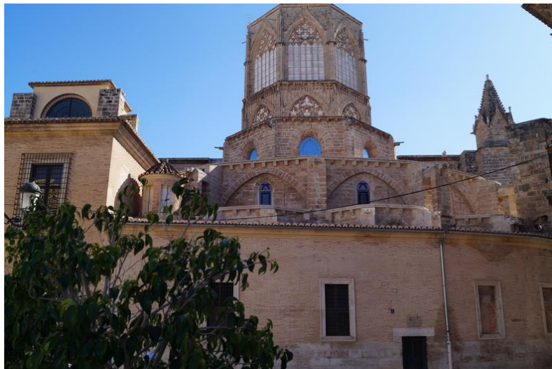
La Seu de Valencia