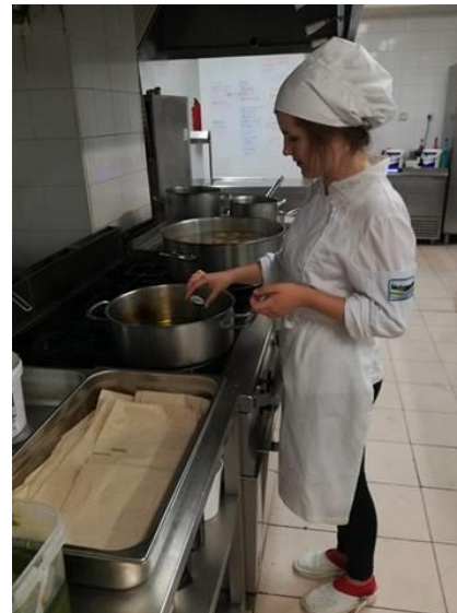
Podczas przyrządzania dania