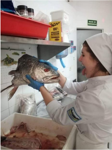
Przygotowywanie ryb do wywaru