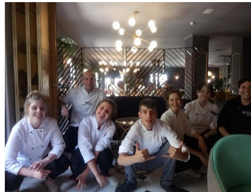
Nauka „słowiańskiego przykucu”