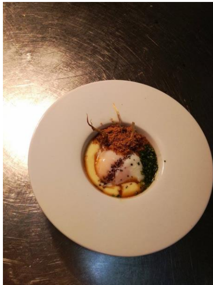
Ole mis huevos