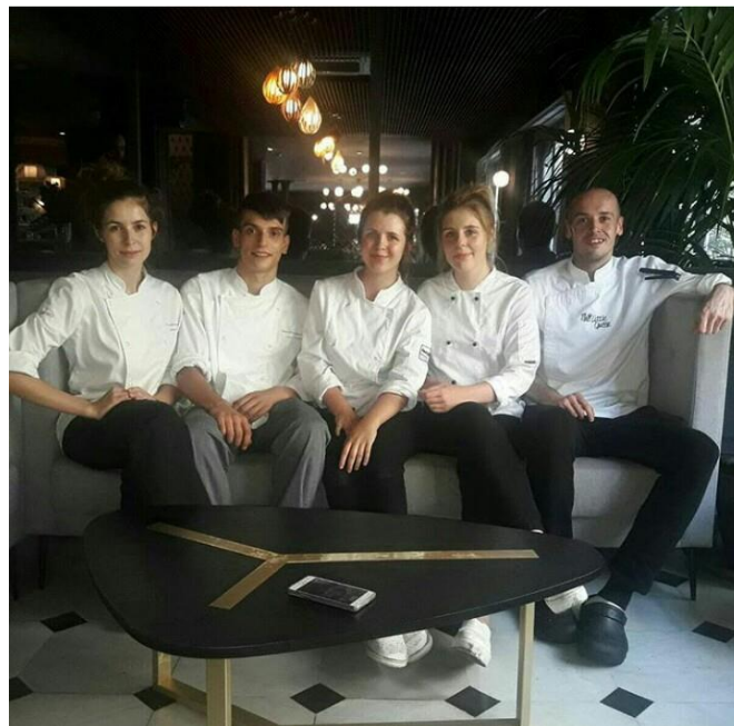
Sesja w restauracji