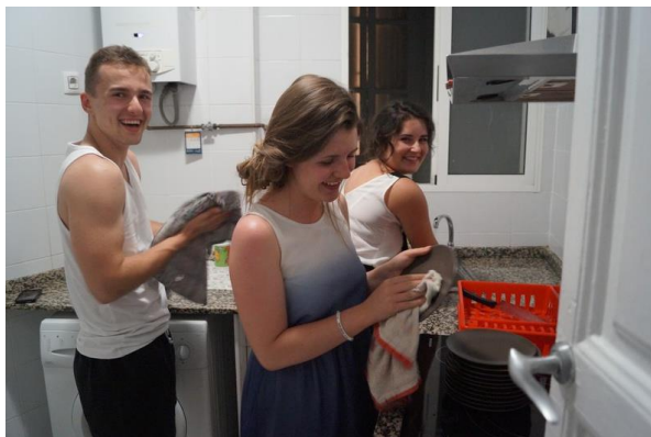
Wykonywanie obowiązków domowych