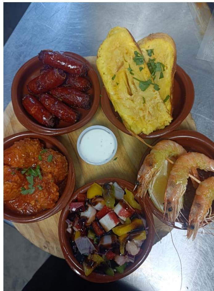
Deska tapas (tortilla, gambas, chorizo...)