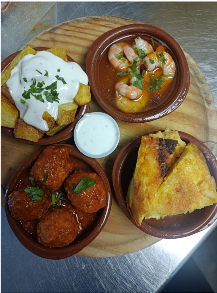
Deska tapas (patatas bravas con allioli,gambas al pil pil,tortilla...)