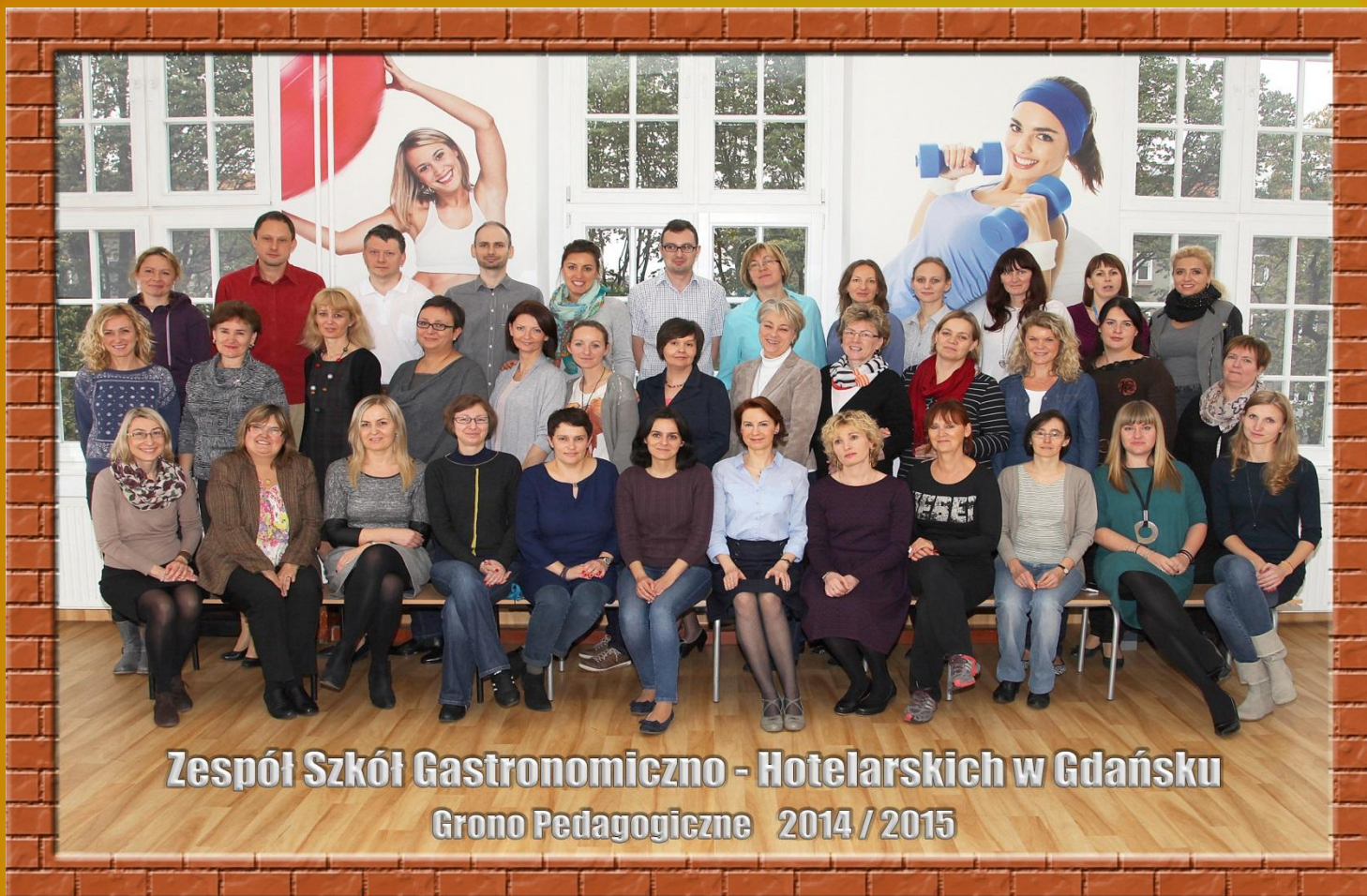
Zespół Szkół Gastronomiczno - Hotelarskich w Gdańsku Grono Pedagogiczne 2014 / 2015

21.10.2014r. - sesja zdjęciowa dla całej społeczności szkolnej