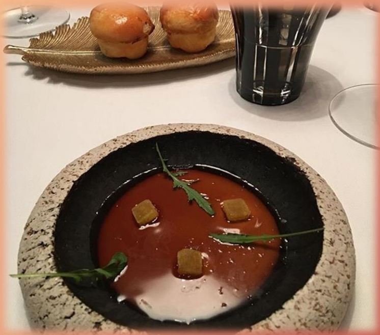
Cuba Libre de foie gras