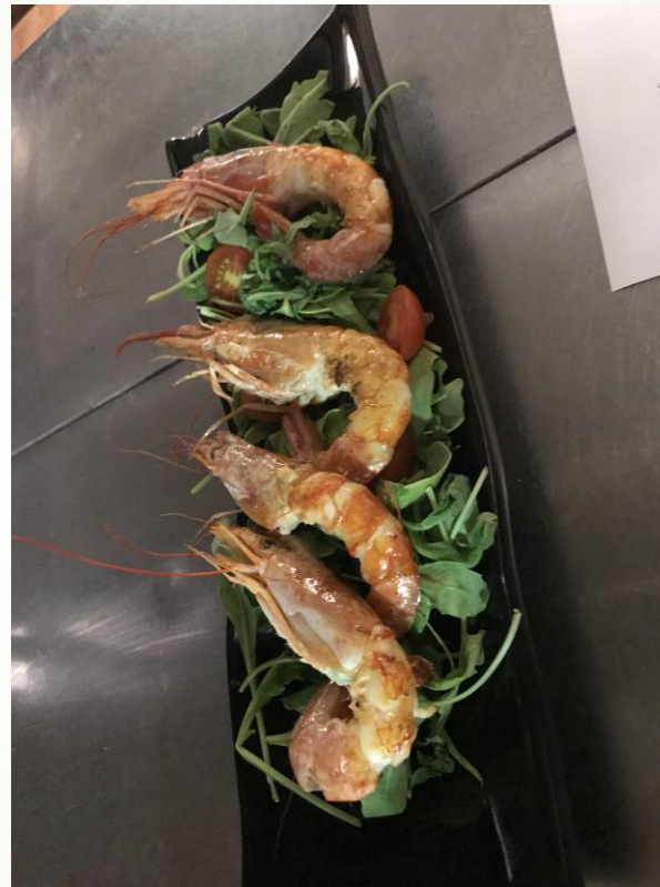
Ensalada con gambas