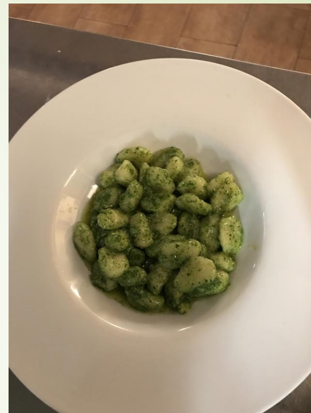
Gnocchi con pesto