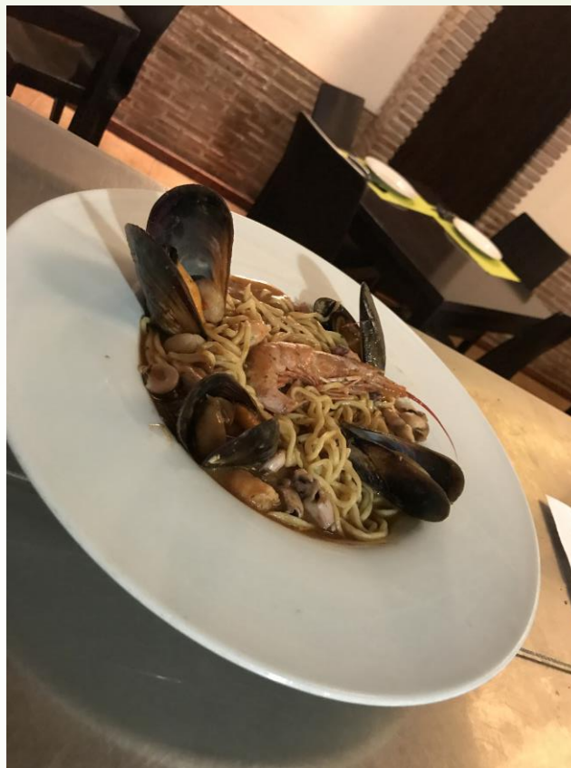
Spaghetti Frutti di mare