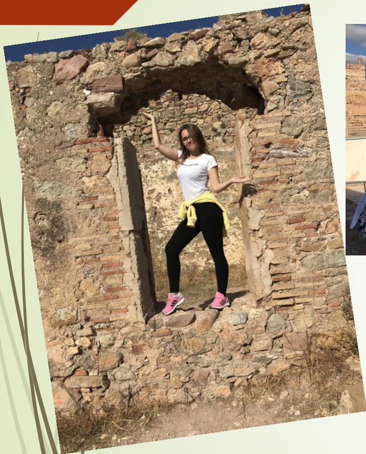
Ruiny zamku w Sagunto