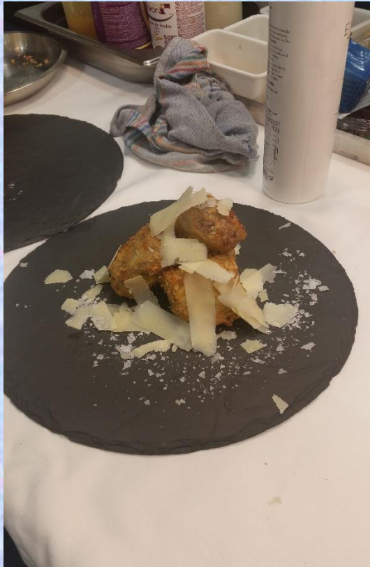
„OSSO BUCO” CON PARMESAN