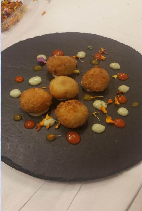
CROQUETTAS Z SZYNKĄ IBERICO