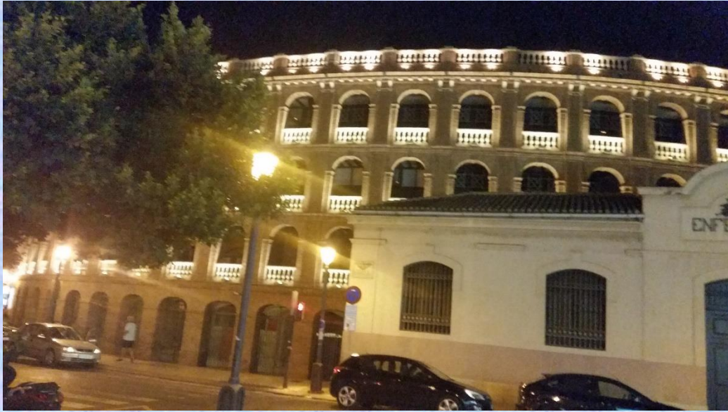
PLAZA DE TORROS