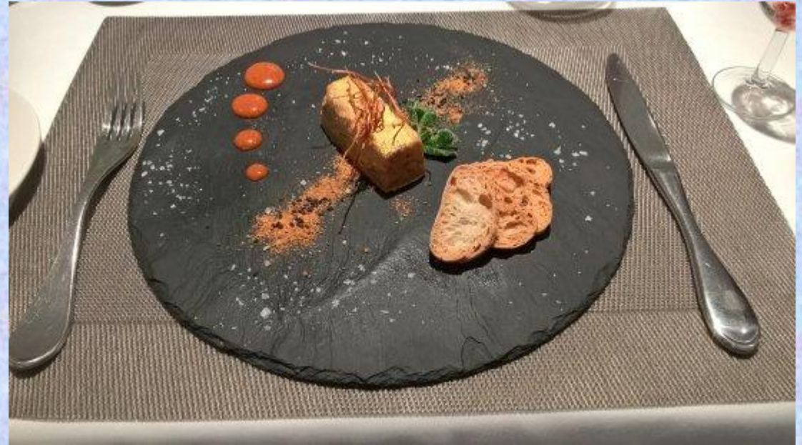
FOIE GRAS GOLD CON CRUMBLE Y KUMQUAT MARMELADE