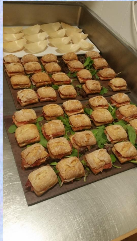
SANDWICHES CON SERRANO Y TOMATOS