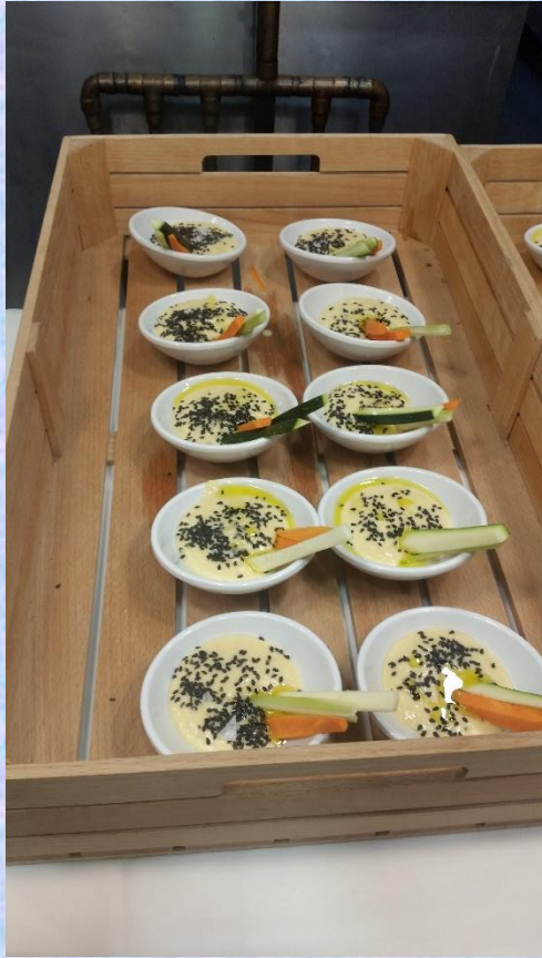
HUMMUS CON VERDURAS