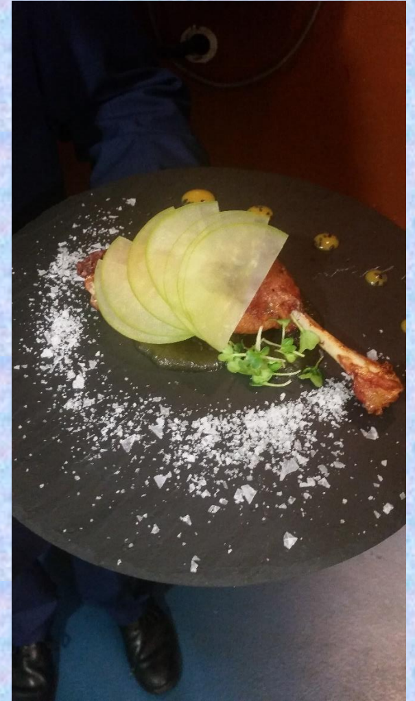
DUCK CONFIT WITH APPLE COMPOTE IN A SLIGHTLY SHARP DRESSING