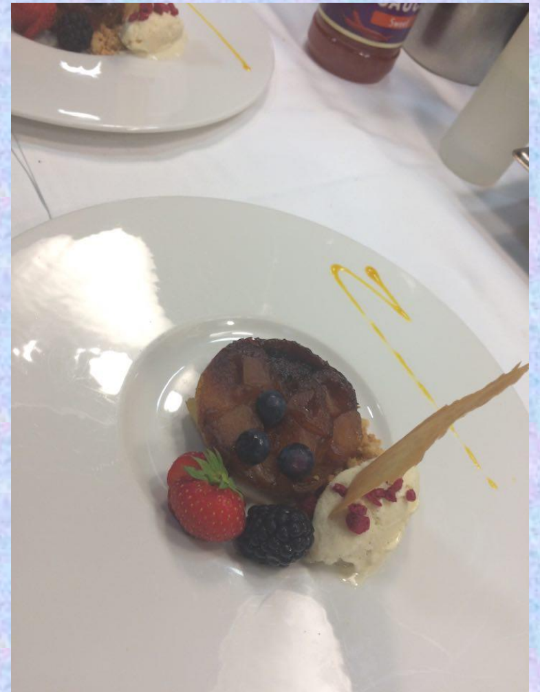
Tatin de mango