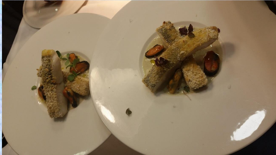
FRESH HAKE FISH WITH CITRUS CRUST, MUSSELS AND CAPERS SAUCE