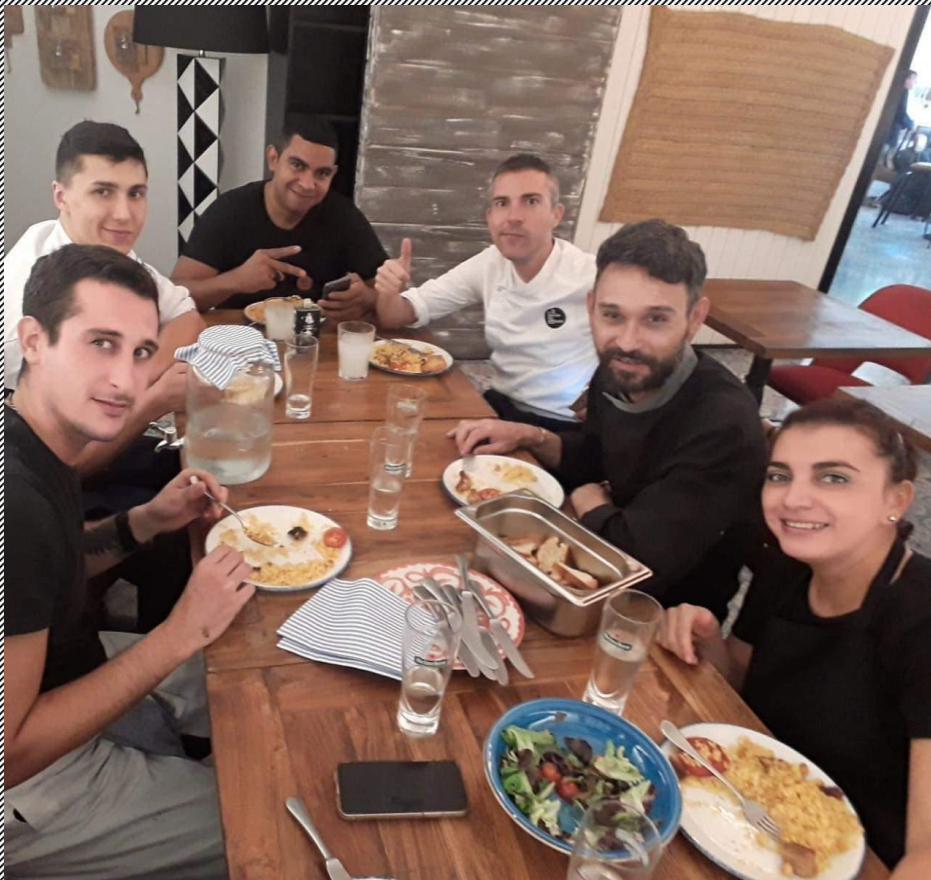
Zespół podczas jedzenia obiadu