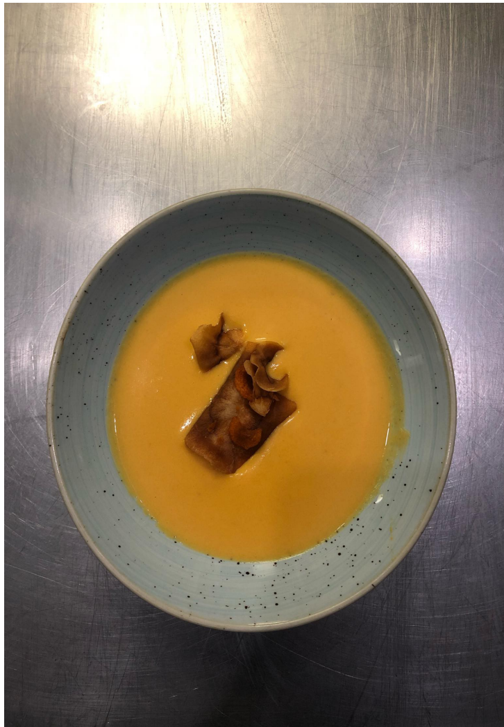
Crema de cabalaza