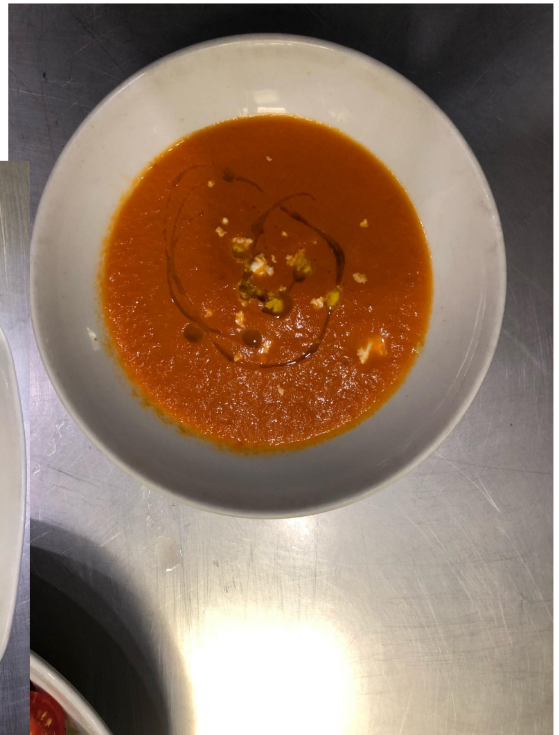
Crema de zanahoria