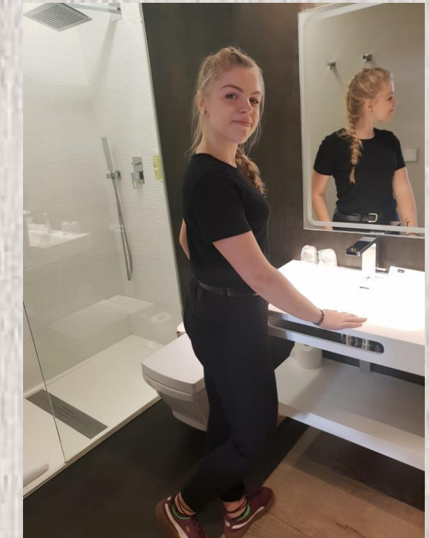
SPRZĄTANIE WĘZÓW HIGINICZNO- SANITARNYCH