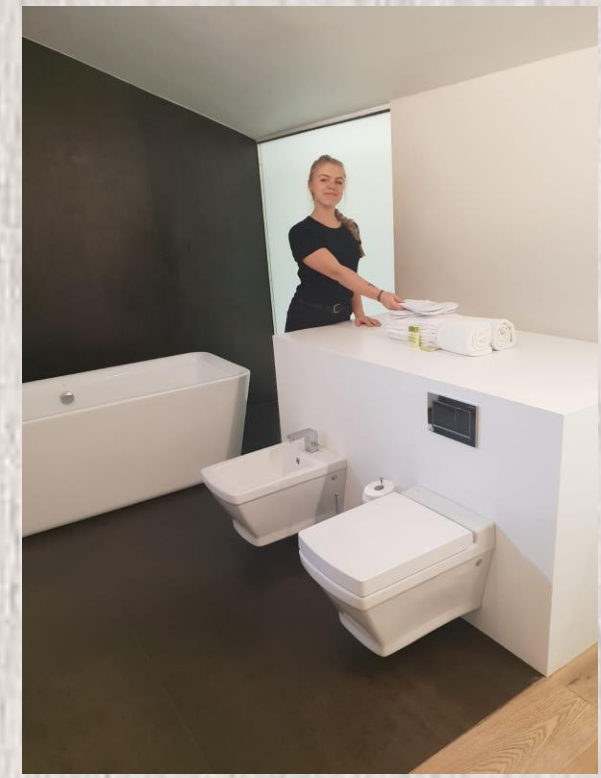
DBANIE O SZCZEGÓŁY