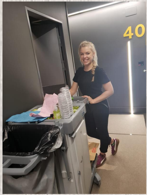
SZYKOWANIE WÓZKÓW POMOCNICZYCH