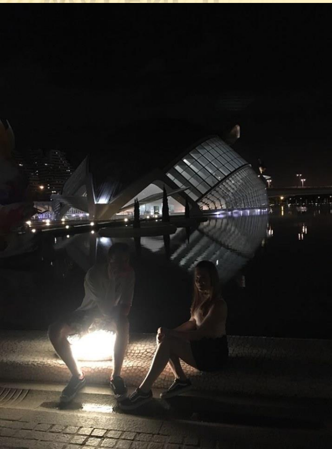
El Palau de les Arts Reina Sofía